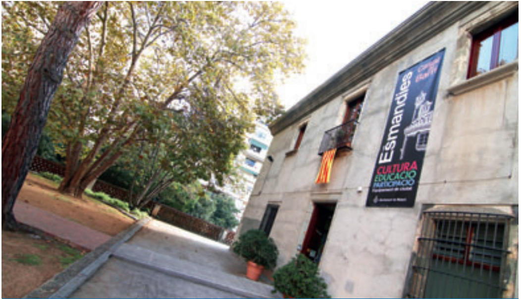
El casal de Les Esmandies està ubicat al número 94 de la ronda O'Donnell.